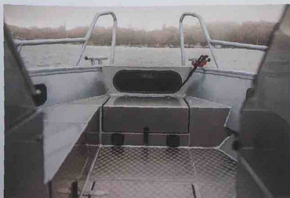
▲ Det är gott om stuvutrymmen ombord, bland annat under förbrunnens soffor och under durken.

Efter att i den bitande kylan ha fotograferat av alla finesser ombord är det dags att testa sjöegenskaperna. Denna råkalla decemberdag är Mälarens vatten dessvärre nästan helt stilla, så vi får nöja oss med några girar utanför Vintervikens folktomma stränder för att utesluta att skrovet har några direkt farliga egenskaper.