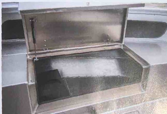
▲ Alla stuvfack har gasdämpare och faller på plats ned på fingrarna. Båten gungar till. Säkert!