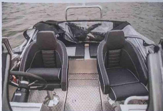
▲ Den enda missen ombord är att kapellgarage saknas. Därför får kapellet i nedfällt läge lite slarvigt byttas ihop i aktersoffan.