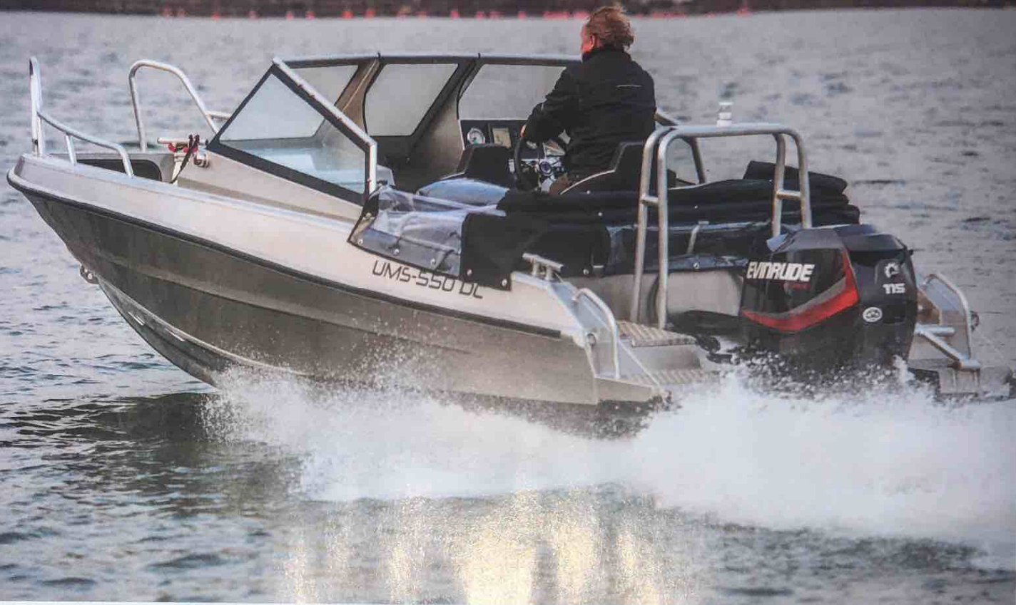
▲ En 115 hästars Evinrude räcker gott för båten, som troligen klarar sig fint även med en 90 hästars motor.