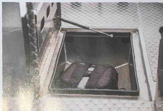
▲ Rejäl stuvfack. Durken är ovanligt på alubåtar i den här storleken. Men UMS 550 har två durken som vardera rymmer en 40 liters ryggsäck.

navigator, rutramen är tillräckligt hög för att ge vindskydd åt mig som är 177 centimeter lång. Här, på instrumentpanelen, finns också ett fack där mobiltelefon eller solglasögon ryms – en vettig finess som frustrerande nog, trots att Båtnytt tjarar om det i 30 år, fortfarande saknas på de flesta moderna båtar.