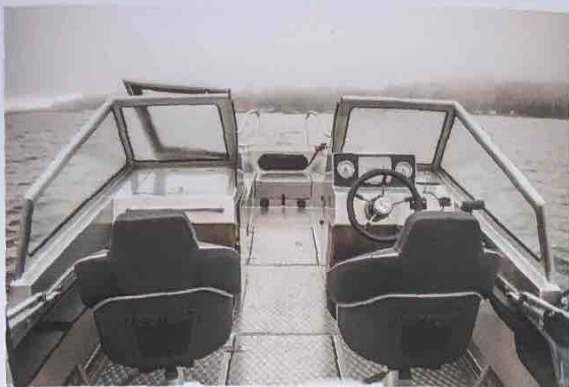
▲ Durk, rutram och konsoler är alla ihopsvetsade. Det borgar för en stabil båt som lär hålla nästintill för evigt.